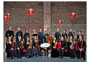
L'ensemble allemand Concerto Köln.

Pully, collège de Champittet Ve 3 décembre (19 h 30) Rens.: monbillet.ch