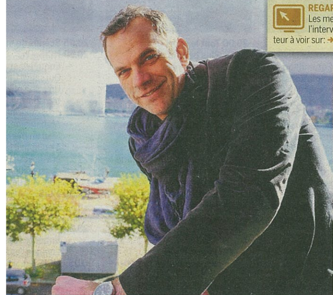
st un stakhanoviste: «Il me faut tout le temps un projet.»